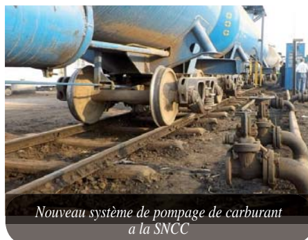
Nouveau système de pompage de carburant à la SNCC