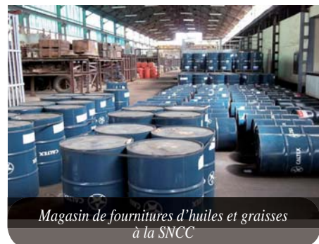
Magasin de fournitures d'huiles et graisses à la SNCC