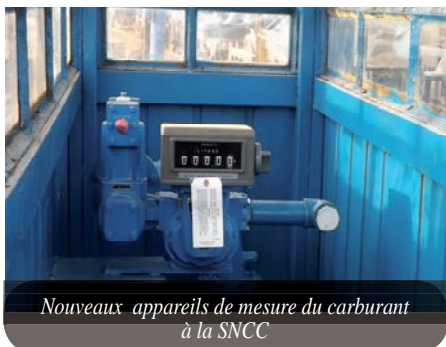
Nouveaux appareils de mesure du carburant à la SNCC

La SNCC, pilier du transport ferroviaire en RDC, connaît des difficultés financières, notamment celles liées à l'achat régulier de carburants et lubrifiants. En finançant le PTM, la Banque Mondiale tient au redressement de la situation technique, opérationnelle et financière de cette entreprise. Ce qui doit être la conséquence d'une bonne gestion de ses activités, d'un côté et de l'optimisation de l'organisation des processus et procédures de l'entreprise, de l'autre. La situation actuelle est que la SNCC ne peut, avec ses propres ressources internes, opérer un redressement rapide de ses activités afin d'assurer sa survie.