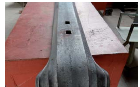
Modèle de Traverse métallique percée avec bèches d'ancrage évasées plongeante