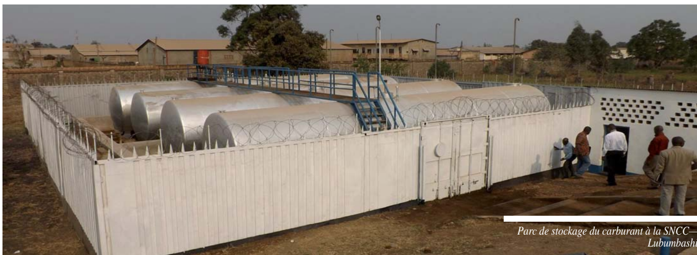
Parc de stockage du carburant à la SNCC— Lubumbashi

La relance des activités opérationnelles de la Société nationale des Chemins de fer du Congo (SNCC) passe par la réhabilitation de la voie (+/-1600/3641km) et l'acquisition de nouvelles locomotives afin d'augmenter sa capacité de traction, laquelle, à ce jour, ne génère que l'équivalent de la moitié de ses charges, soit +/- 3,3 millions de USD.